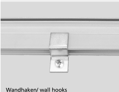
Wandhaken/ wall hooks